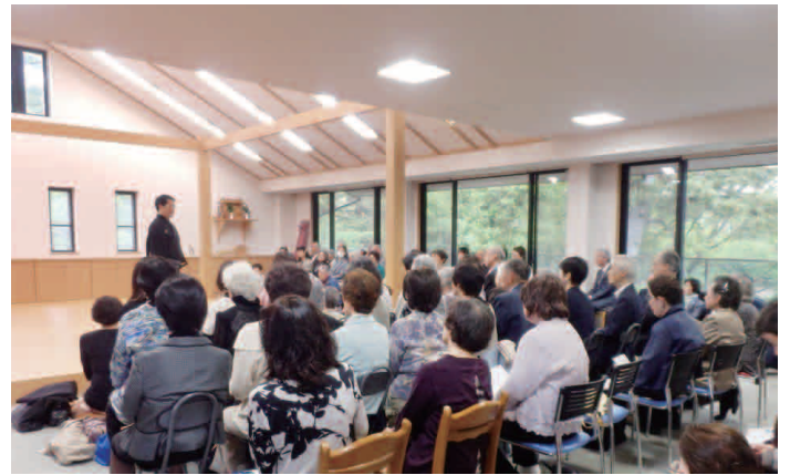
演者による曲目解説もごぞいます。

能とは、能楽の一番本格的な上演の形です。登場人物は皆、能装束を付け、囃子、地謡に囲まれた空間で、謡や舞を通して、一曲に込められた物語をご覧ください。